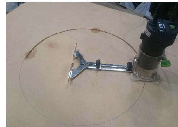
トリマによる穴開け(2段階)