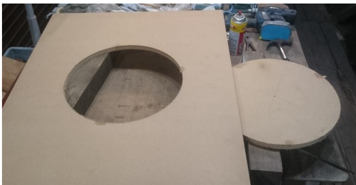
高儀のトリマは, 意外と使える ネットでは悪評があるが, 正しく使えば, 問題ないか