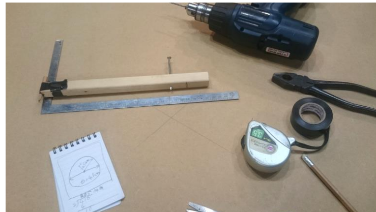
手元の20mmMDF合板にD=410mm穴径