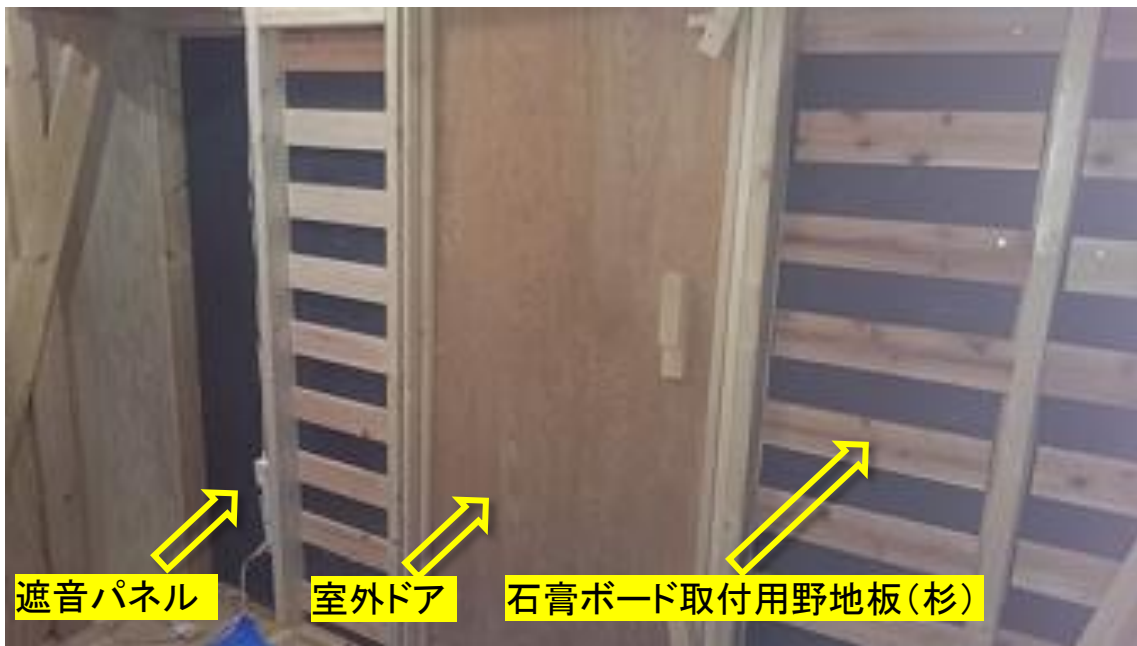
室内:防音用石膏ボード取り付けのための下地 2018.3.5