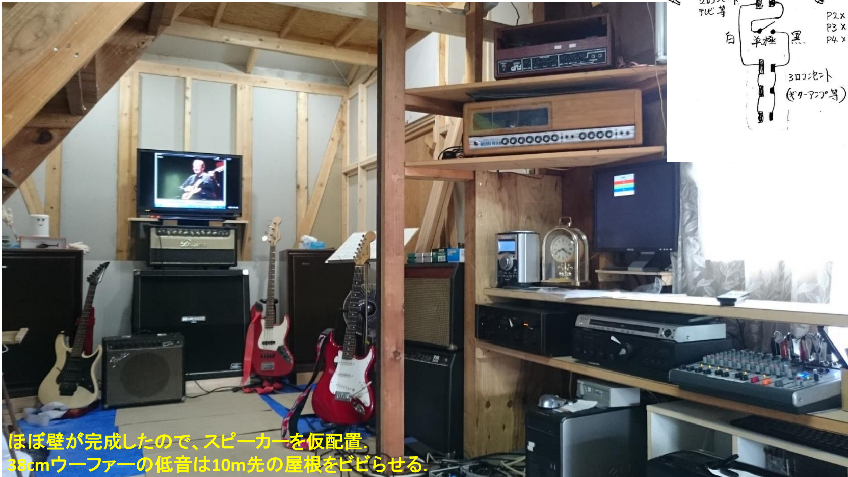
ほぼ壁が完成したので、スピーカーを仮配置。 38cmウーファの低音は10m先の屋根をビビらせる。

増築部電気工事: 1階と2階は個別の配線用遮断器を割り当てた。 電気事業法に抵触しないように、電気工事士の資格を取得した。