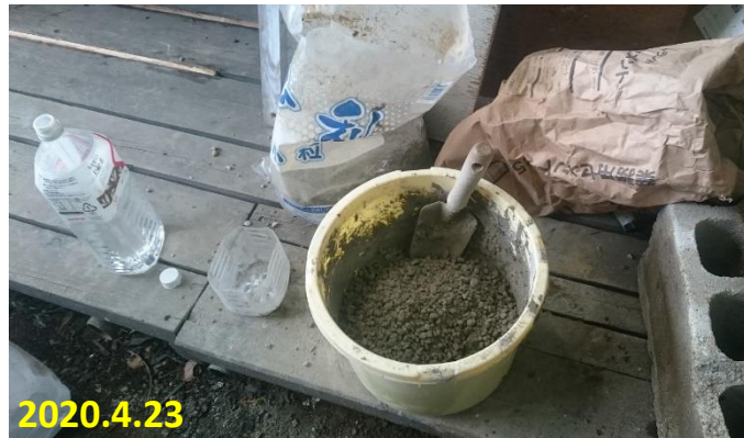
生コン作り 砂利3, 砂3, セメント2位の割合でかき 混ぜておく。水は入れない。