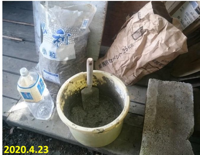
生コン作り 水を少しづつ入れ、かき混ぜる。下痢グソ 状にする。入れ過ぎないように気を付ける。 小規模なので、こんな漬物桶で充分だ。 本格的な船など要らない。結構重労働だ。