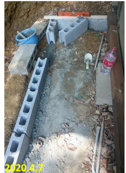
基礎作り 生コンを約3cm位入れて、その上にブ ロックを置く。ブロックは重量タイプを 使用。直線状にするのが大変。物置 ならば、このくらいの生コンで充分だ。