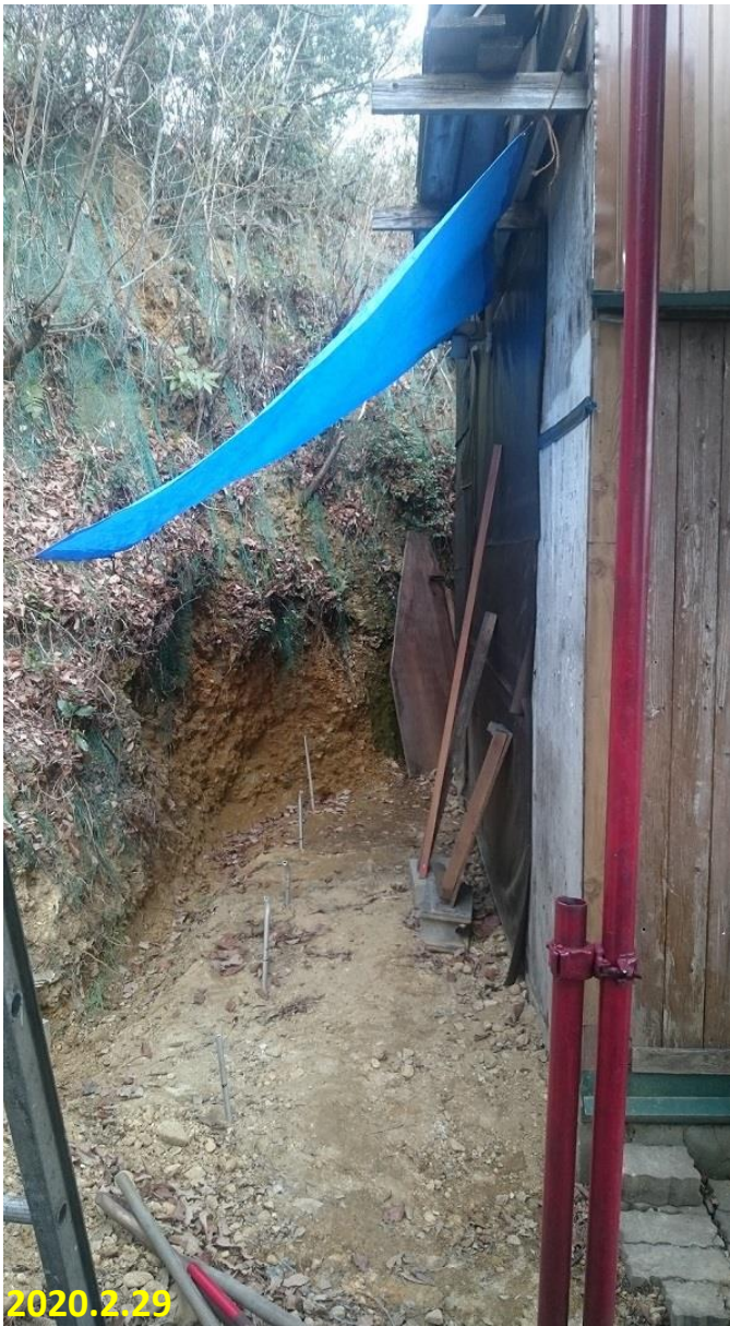
土手を切崩し、基礎となる基準を決める。 母屋を基準とし、杭を打ち、水平位置を記す。