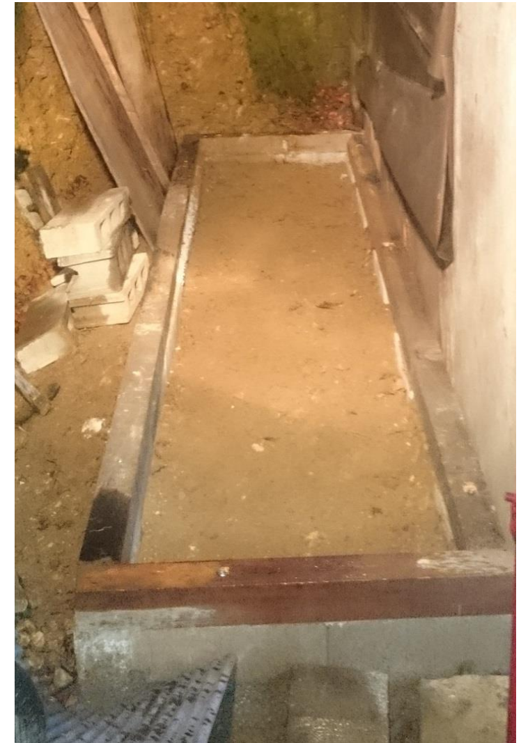
大引き固定完了 次は、柱を立てて屋根を作る。 梅雨に入る前に、屋根を完成させなくては