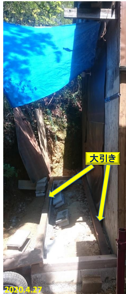
大引きを、ブロックで作った基礎に固定する。