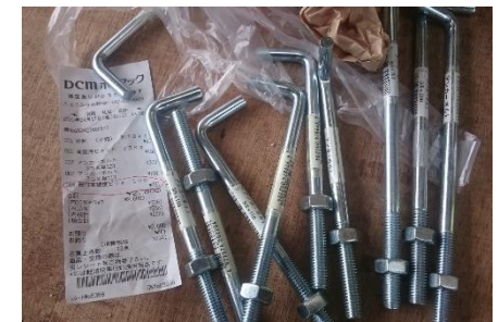
大引き固定アンカー 予め、アンカーを埋め込んでおく。 床束は省略(低床式)。