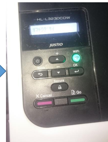
セットすると、おもむろに認識する