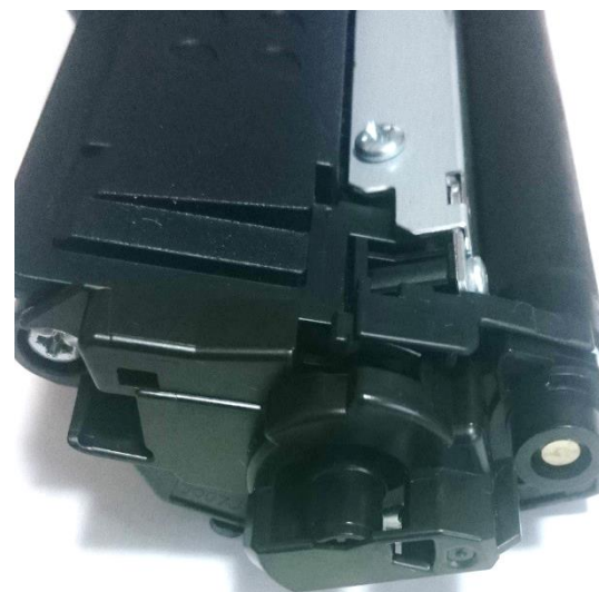
ブラザー純正のカートリッジ ロックピンとカウンタが見えないなあー