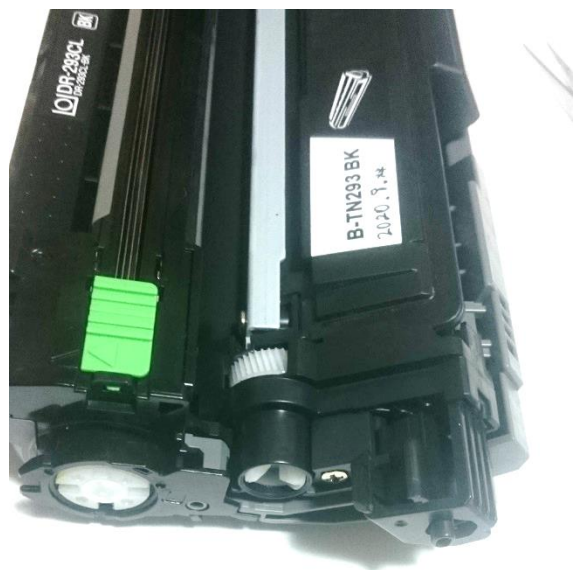
ドラムユニットにセットし反対側から撮影