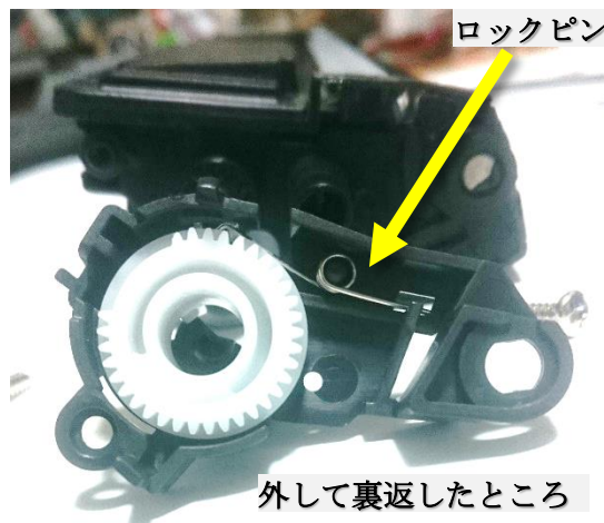
ピンが外れた状態 (内側) なので元に戻す