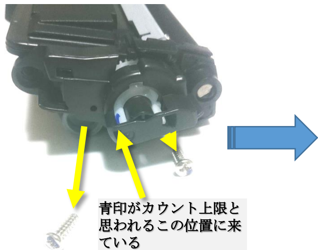
新品カートリッジのネジ2本外す

新品カートリッジを入れても、いつまでも新しいカートリッジの交換を要求されてしまう問題を解決 (カウンタを手動で初期リセットする)