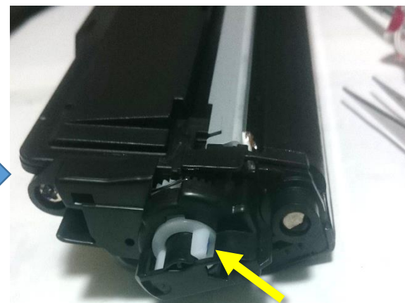
カウンタの位置を初期の状態にする