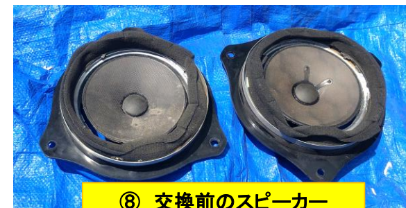
⑧ 交換前のスピーカー 二つともエッジが破れていた