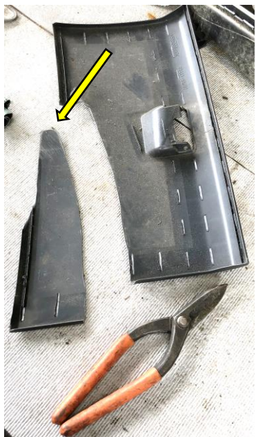
②内張りはがしを製作 ドアカバー剥しも兼用