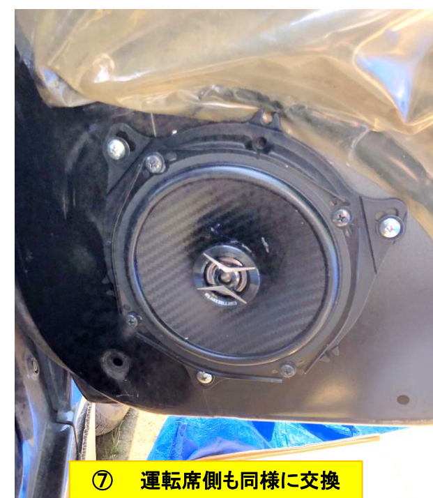
⑦ 運転席側も同様に交換