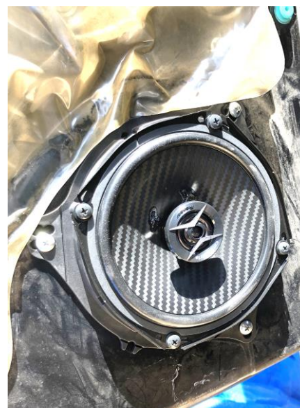
⑥ 新品と交換え(2WAY) 迫力の低音, クリアな高音