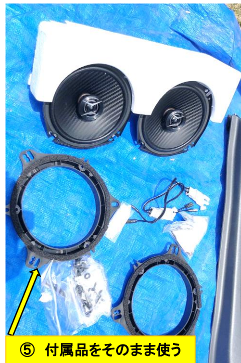
⑤ 付属品をそのまま使う