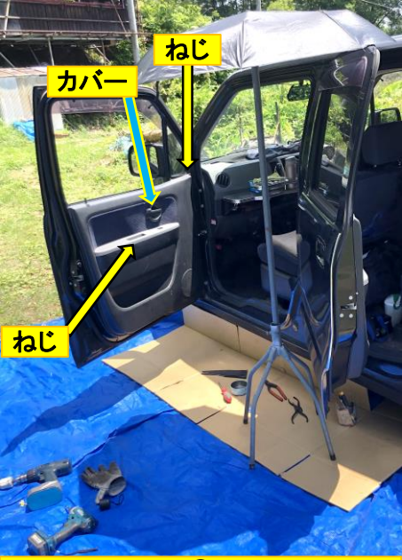
① 2本のねじとドアレバーカバーを外す