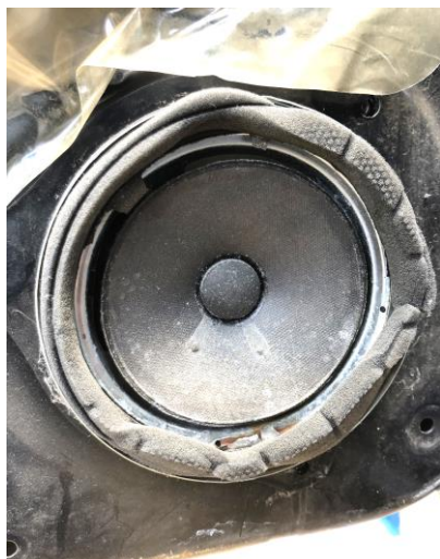
④ エッジは破れて消滅 ベンチャーズをMAXで聞いた結果